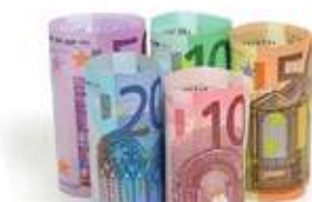
Para el resto