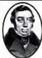
John Ayrton Paris

El taumatropo es un divertimento óptico inventado por John Ayrton Paris en 1824. Consiste en un disco con dos imágenes diferentes an ambos lados y un trozo de cuerda a cada lado del disco. Al girar el disco se produce la ilusión, por el principio de persistencia retiniana, de que ambas imágenes están juntas.